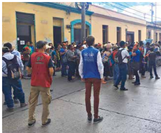
► Demonstration des „Friedlichen Widerstandes von Santa María Cahabon“ in der Hauptstadt Guatemala-Stadt