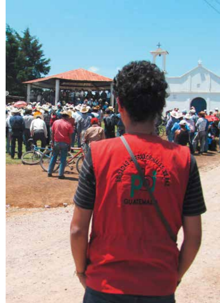
► Ein Freiwilliger von pbi beobachtet eine Versammlung der Indigenen-Organisation Chortí Nuevo Día

Die Aktivist_innen fordern, durch gewaltfreie Protestaktionen und auf juristischem Wege, den Widerruf der Lizenzen für das dortige Unternehmen Oxec. Die Lizenzen wurden von den Behörden erteilt, ohne dass eine Konsultierung der dort lebenden indigenen Gemeinden durchgeführt wurde. Dies widerspricht dem Übereinkommen 169 der Internationalen Arbeitsorganisation (ILO).