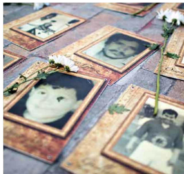
► Portraits von Opfern des kolumbianischen Konflikts